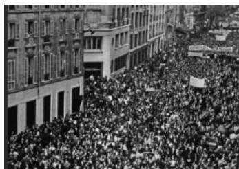
Revoluția Română a dus la căderea regimului comunist.

Fondator S.C. S. A. Mopariv. Valcea ca societate pe acțiuni.